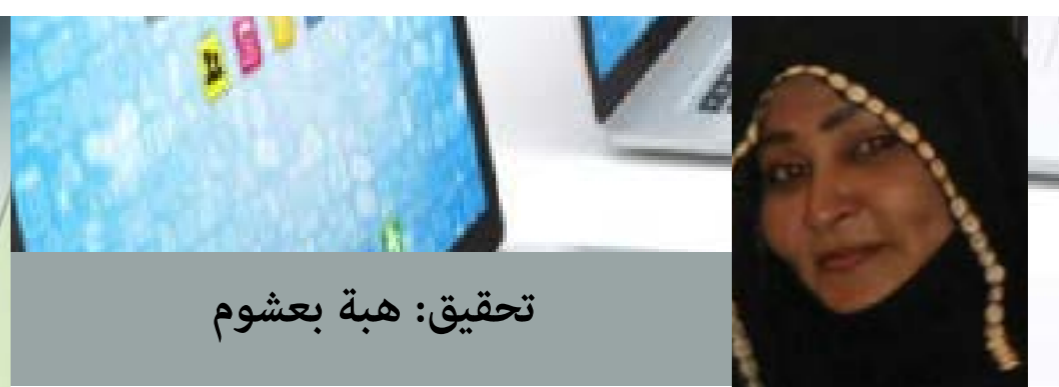
تحقيق: هبة بعشوم

في الآونة الأخيرة، شهد العالم تطوراً متسارعاً بفعل العولمة الرقمية والذكاء الاصطناعي، اللذين أصبحا جزءاً لا يتجزأ من تفاصيل الحياة اليومية، وامتد تأثيرهما بوضوح إلى المؤسسات التعليمية وقاعات الدرس والبحث العلمي. هذا التحول الرقمي الهائل، رغم ما يحمله من فرص واسعة للتعليم والإبداع وتسريع الوصول إلى المعلومة، أفرز في المقابل تحديات حقيقية تتعلق بمستقبل المعرفة، واستقلالية الطالب في تحصيلها، وقدرته على التفكير النقدي والبحث الذاتي بعيداً عن الاعتماد الكامل على الأدوات الذكية. وانطلاقاً من هذا الواقع، أجرت صحيفة جامعة الجزيرة هذا التحقيق للوقوف على آراء أكاديميين وخبراء وطلاب حول سؤال محوري يفرض نفسه بقوة في عصر الذكاء الاصطناعي: